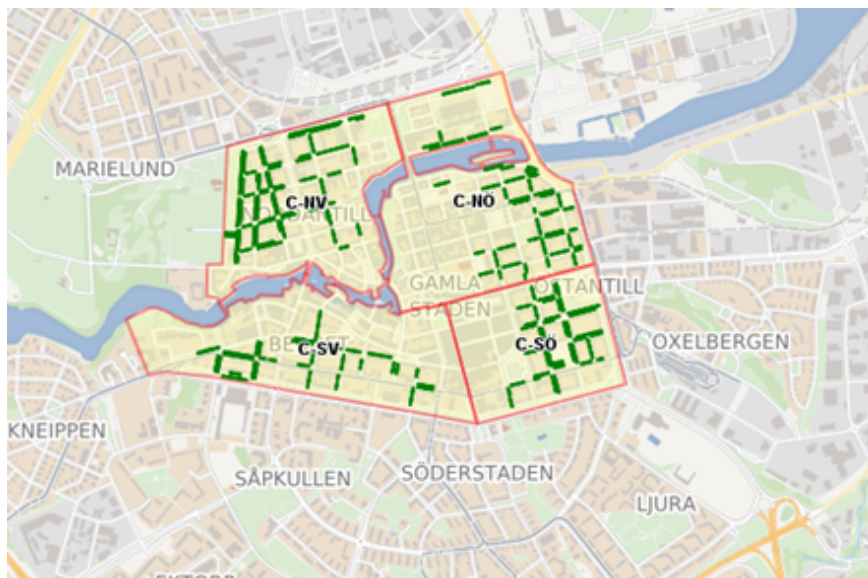
Bild 1: Karta över boendeparkeringsområdena innanför promenaderna.

Kontoret föreslår en höjning med 110 kr per månad för boendeparkering i områden C-NV, C-NÖ, C-SV och C-SÖ.