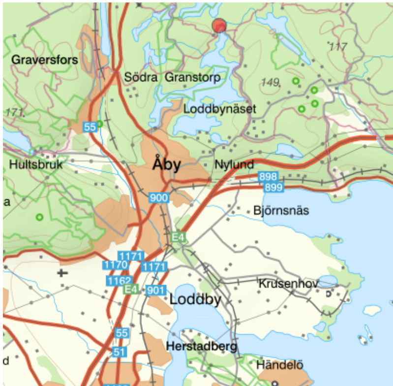
Karta som visar det föreslagna områdets lokalisering med röd prick.