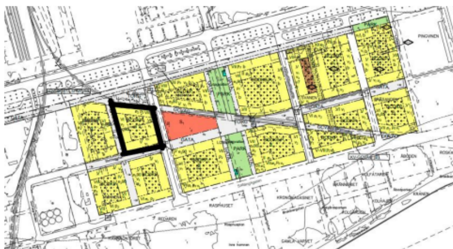
Svartmarkering på detaljplanen avser Kv Ankan.

Bedömningen har gjorts av en jury bestående av sju (7) personer, fem (5) från Samhällsbyggnadskontoret och två (2) Arkitekter utsedda av Sveriges arkitekter. Preservia med tillhörande samarbetspartner Kian Properties AB och Moelven byggmodul AB utsågs till vinnare. Förslaget har också tagits fram tillsammans med arkitektbolaget Kiminsky arkitektur och Mareld landskapsarkitekter.