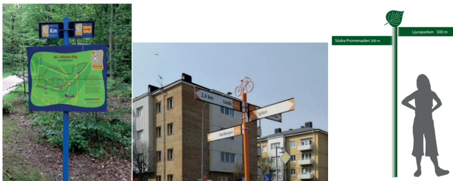
Hälsans stig grafiska profil till vänster och kommunens grafiska profil i mitten och till höger

ske i samverkan med detta arbete för att locka människor till de investeringar som gjorts i t.ex. stadsdelsparker och promenader. Samma grafiska profil och installering av stolpar skulle också kunna utnyttjas.