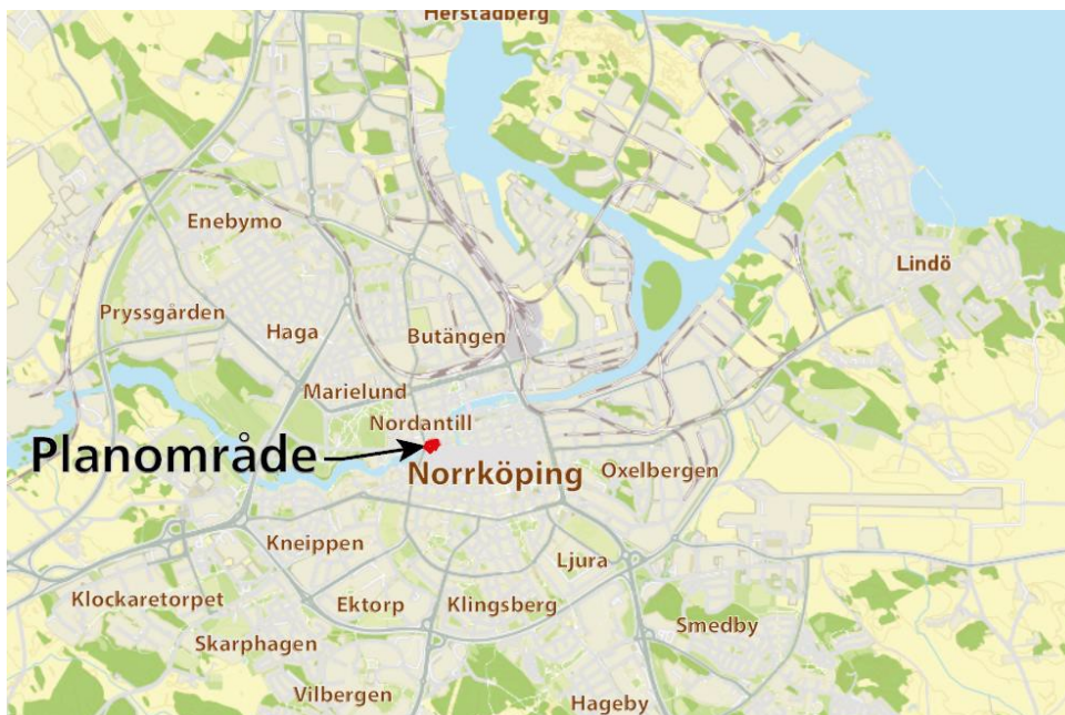
Figur 1. Kartan ovan visar planområdets läge i Norrköping. Karta: Norrköpings kommun.

Det berörda området ligger centralt i Norrköping, i det historiskt värdefulla Industrilandskapet. Planområdet avgränsas av Bredgatan i norr, Motala ström i söder, Skvallertorget och Bergsbron i väster och fastigheterna Bergsbron 8 och Mjölaren 16 i öster, se figur 1 och figur 2.