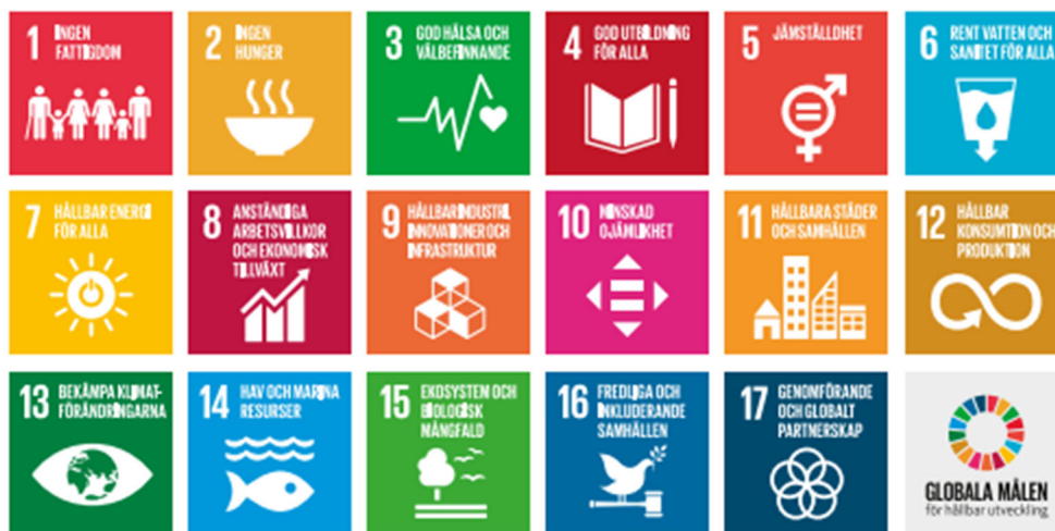
17 Globala mål för en hållbar utveckling

Norrköpings kommun ställer sig bakom de globala målen för hållbar utveckling (Agenda 2030) som världens stats- och regeringschefer antog 2015. Mandatperiodens övergripande mål är kopplade till de globala målen.