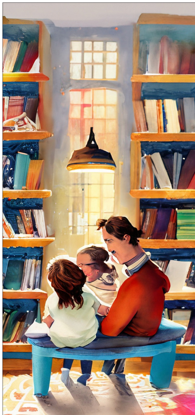
Illustration: Adobe Firefly AI

En strategisk förflyttning är därför att gå från erbjudandet i fokus till upplevelsen i fokus. Detta görs genom förbättrade möjligheter till medskapande för bibliotekets användare. Det görs genom ett tydligt värdskap, professionell service och ett välkomnande bemötande. Det görs genom attraktiva och moderna digitala tjänster. Det görs genom metodiskt trygghetsskapande arbete. Det görs också genom nödvändiga rumsliga förbättringar och välkomnande entréer.