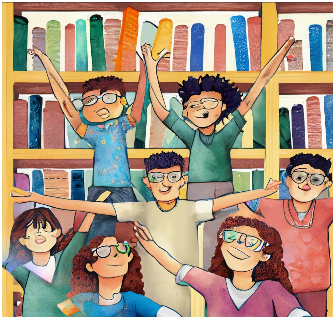
Illustration: Adobe Firefly AI

Biblioteket ska gå från erbjudandet i fokus till upplevelsen i fokus. Detta görs genom förbättrade möjligheter till medskapande för bibliotekets användare. Det görs genom ett tydligt värdskap och ett välkomnande bemötande. Det görs genom attraktiva och moderna digitala tjänster. Det görs genom att bredda kompetensen. Det görs genom metodiskt trygghetskapande arbete. Det görs också genom nödvändiga rumsliga förbättringar och välkomnande entréer.