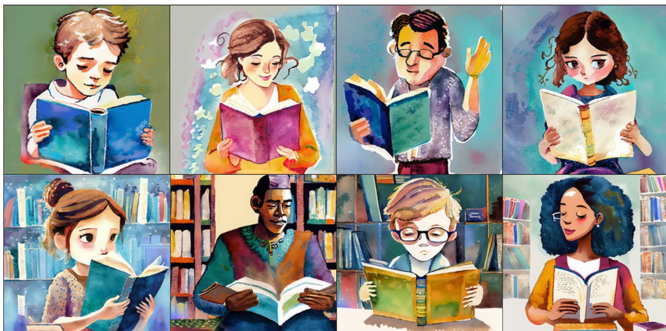
Illustration: Adobe Firefly AI