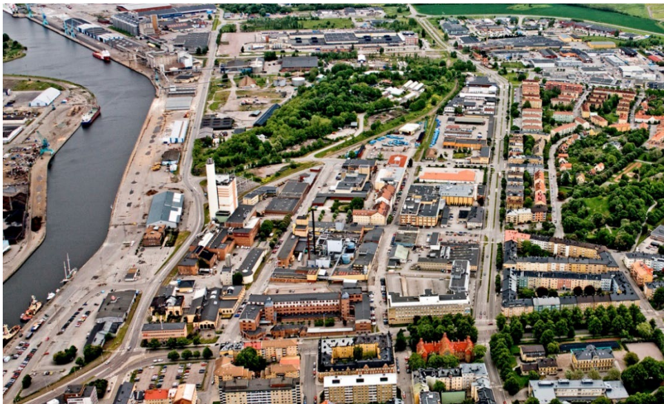
Figur 2. Flygbild över Sylten med Östra Promenaden i nerkant och Söderleden i längst upp i bild (2014).

Utvecklingsområdet Sylten pekas ut för blandad stadsbebyggelse i översiktsplan för staden. I översiktsplanen uttrycks följande strategi: