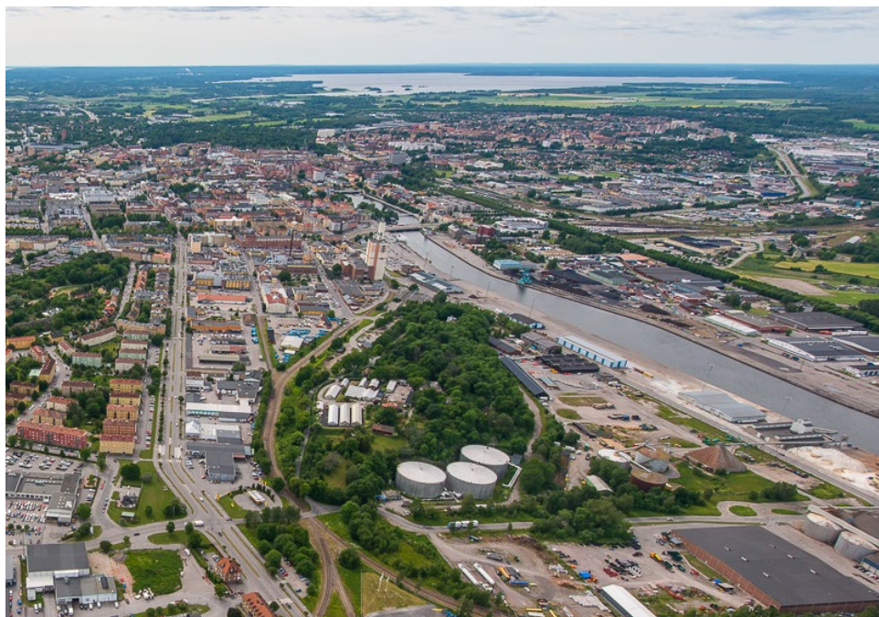
Figur 3. Flygbild över Sylten med Syltenberget mitt i bild (2014).

Freudenbergs tillverkning av Wettex påverkar möjligheter till omvandling och förtätning. Företaget har med ett flertal åtgärder minskat riskbilden vid hantering av kemikalier avsevärt. Lukt från tillverkningen och buller från transporter och större ventilationssystem till Freudenbergs och andra verksamheter är annat som påverkar, framförallt möjligheter att bygga bostäder i anslutande kvarter.