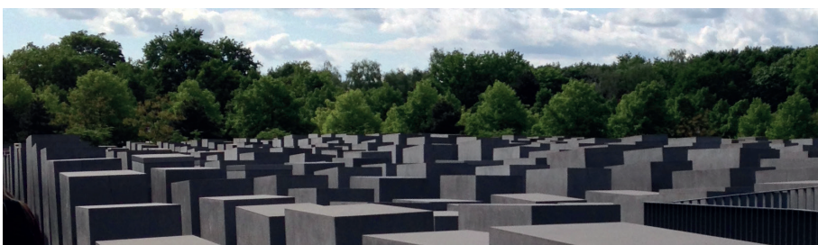
Bild från Förintelsens minnesmonument i Berlin

Stunden avslutas med bönen för Förintelsens offer "El Malei Rachamim".